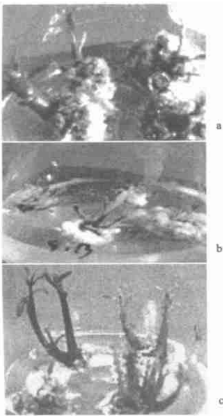
图 1 生长调节剂对芽增殖的影响

Fig. 1 Effects of growth regulator on shoot germination