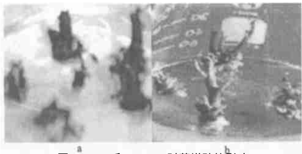
图 2 PP 333 和 AgNO 3 对芽增殖的影响

a. Cluster shoot formation under KT; b. Cluster shoot formation under BA; c. Cluster shoot formation under ZT.