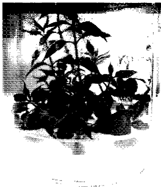
图1 继代增殖培养结果