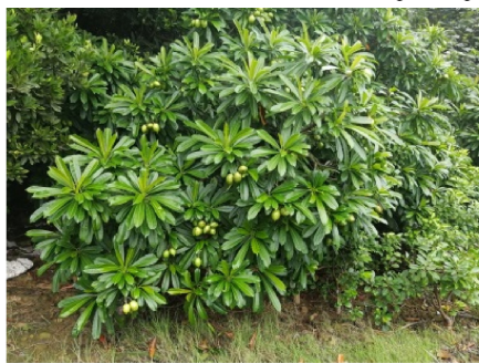
Fig. 18 Plant, flowers and fruits of Thespesia populnea