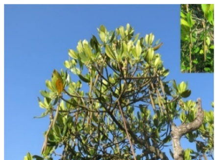
图9 红海榄支柱根、花和胚轴