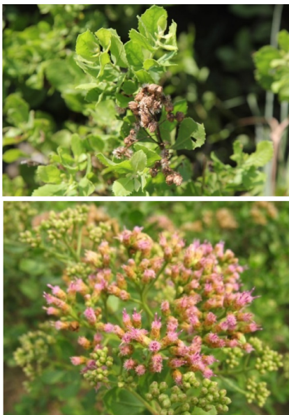
图 16 阔苞菊