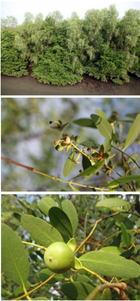
图 13 无瓣海桑人工林、花和果实