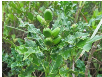
图 6 老鼠簕植株及其花、果