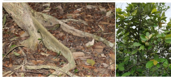
图 20 银叶树植株、板状根及果实