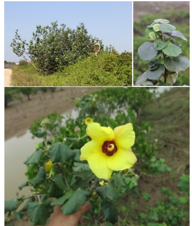
图 17 黄槿植株、叶和花

黄槿是锦葵科木槿属常绿灌木或乔木,高可达 10 m;花黄色,盛开时艳丽;果实球形(图 17)。常见于红树林林缘,高潮线上缘的海岸沙地、堤坝或村落附近,也可以在完全不受海水影响的淡水环境中生活。广西沿海各村落房前屋后均有栽植,偶见于远离沿海的内陆公园。