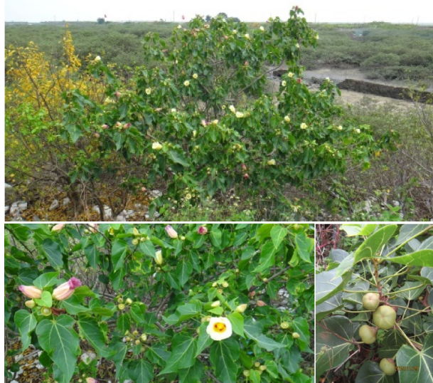
图 18 杨叶肖槿植株、花和果实