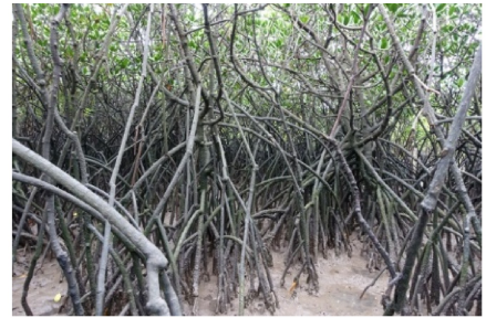
Fig. 8 The largest natural Rhizophora stylosa forest in China(Yingluo Bay, Guangxi)