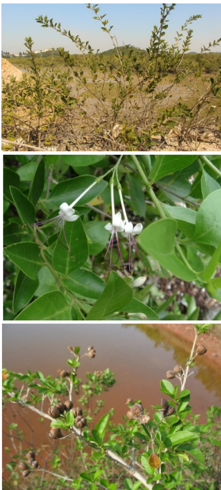
图 15 苦郎树及其花、果