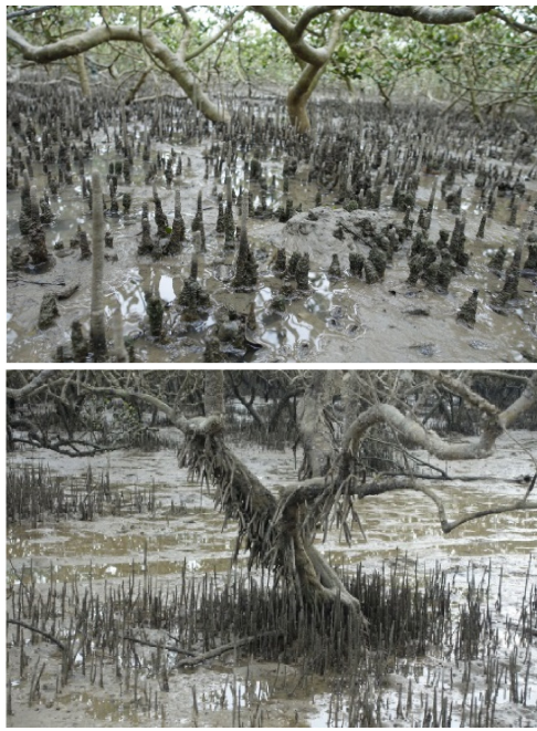
图1 白骨壤指状呼吸根和气生根

骨壤果实为“榄钱”，“榄钱”经处理后与文蛤一起煮汤或焖煮，为广西沿海最具特色的季节性海洋蔬菜 [9] 。