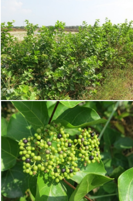
图 22 钝叶臭黄荆植株及果实

钝叶臭黄荆是马鞭草科豆腐柴属攀援状灌木,高1~2 m;花序似伞状生于枝顶,果实球形,熟时变黑色(图 22)。多生长于海岸灌丛或大潮可以淹没的海岸林林缘,也常在虾塘取水用的水沟中出现。山口保护区与北仑河口保护区较常见,其余天然海岸偶见。