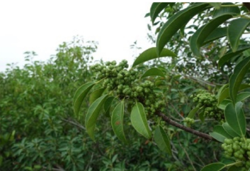
图7 海漆表面根、叶、花序和果实