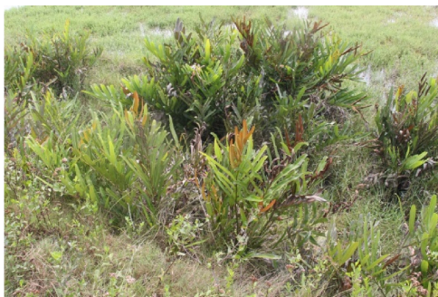
图 5 卤蕨

卤蕨是卤蕨科卤蕨属多年生的草本植物, 高可达 2 m, 叶脉网状两面可见, 孢子囊满布能育羽片下面 (图 5)。它是广西红树植物中唯一的裸子植物, 又是红树林植物中仅有的一种蕨类植物 [16] 。常见于有淡水输入的高潮带滩涂, 也可以生长在只有特大潮才能影响到的湿润地区。沿海各地泥质塘堤或小沟边可见, 北仑河口保护区有大面积分布。常见。