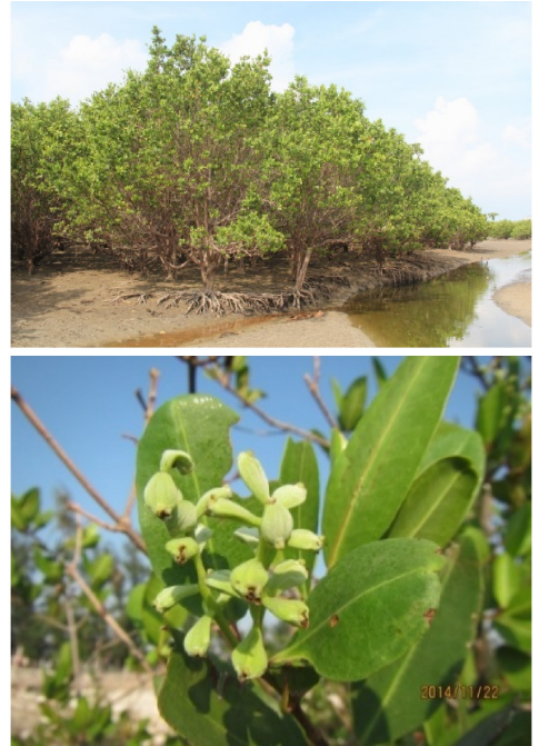
图 14 拉关木人工林及果实

广西最早引种拉关木地区为北海银海区冯家江大桥附近,随后于 2009 年在大冠沙潮滩进行试验造林。经 2013 年测定,四年生试验林平均基径 18.11 cm,平均树高 5.86 m。类似于无瓣海桑,在利用拉关木进行造林时必须保持高度的警惕。