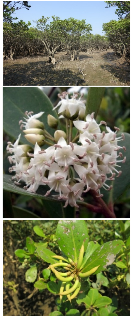
图3 桐花树群落、花、果

分布:红树林分布区潮沟边均有分布，淡水输入充足的河口区，如南流江口、大风江口、钦江口及钦州港等，均有大面积连片分布。常见。