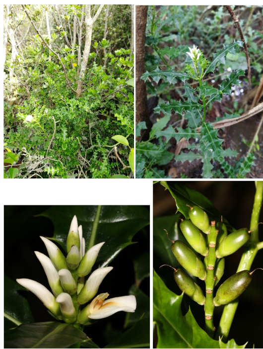
图12 小花老鼠簕群落、植株、花和果实