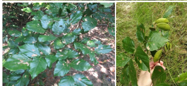
图 21 水黄皮植株、叶及果实