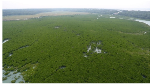
图8 全国连片面积最大的天然红海榄林(英罗港)

红海榄,俗名鸡爪榄,红树科红树属常绿乔木或灌木,高可达8 m;其最显著的特征是具有发达的支柱根;花带淡黄色;具胎生现象,胚轴长圆柱形,长30~40 cm,胚轴表面有点状凸出(图8、图9)。树形