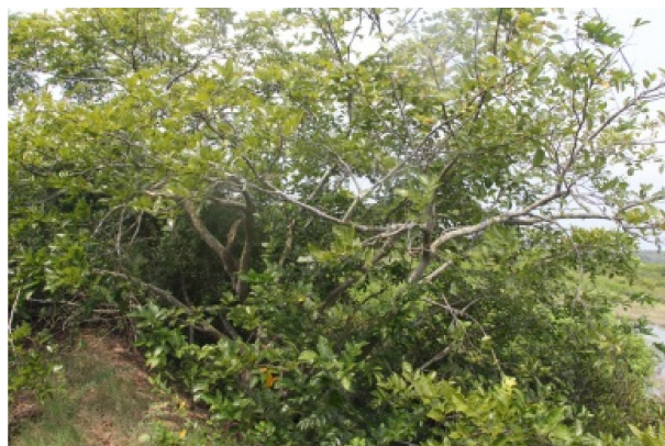
Fig. 20 Plant, plank roots and fruits of Heritiera littoralis