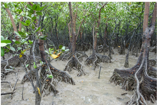
图 4 秋茄植株、板状根、花和胚轴