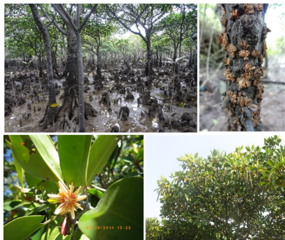
图10 木榄膝状根、皮孔、花和胚轴

木榄是红树科木榄属常绿乔木或灌木,高达6~8 m;常有曲膝状的呼吸根伸出滩面,并在植株基部形成板状根;树干具皮孔;花红色明显;具胎生现象,胚轴较红海榄胚轴更粗但略短,长15~25 cm(图10)。多见于红树林内滩,属于演替后期种类,耐水淹能力比白骨壤、秋茄和红海榄低。北仑河口保护区珍珠湾片区石角、交东管理站,山口红树林保护区英罗管理站、永安村海滩有较大面积连片分布。不常见。