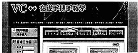
图3 教师备课工作室管理平台

图3是教师备课工作室的界面,它的访问安全性须按照网站建设的技术要求进行设计,对其中的“作业上传”、师生“交流时空”、“试题库”等后台数据库的数据访问均需进行可靠的数据加密。教师备课工作室主要有以下模块:教师身份验证:教师在进入备课工作室时须输入“教师名”、“密码”。作业上传:学生按系、年级、班别、学号、姓名进行作业上传,在“作业上传”模块还安排有上传作业名称、作业内容简要说明。作业批改:教师在“作业管理”模块中输入教师名、密码、登陆后,可对学生上传的作业进行批改。通过“交流时空”进行作业情况反馈。在线考试:教师出题,学生考试,教师评卷。交流时空:发表论题,查看信息,管理留言。其它还有资料管理,教学笔记,教师资料库,习题库,试题库,教师评卷,好书推荐,学术前沿等模块。